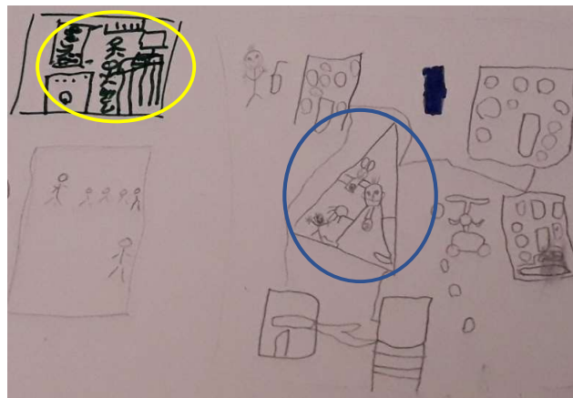
Figuur 3. Kindertekening detentiekamp (jongen, 5 jaar)

In het transitieproces van ontworteling naar zich opnieuw te kunnen thuisvoelen in een nieuwe vertrouwde omgeving spelen de moeders een belangrijke en betekenisvolle rol. De scheiding van moeders en kinderen bij aankomst in de luchthaven heeft op dit proces een zeer negatieve impact die riskeert te belemmeren dat de kinderen zich opnieuw zullen kunnen thuisvoelen. Voor verschillende kinderen is het gemis van hun moeder zodanig groot en pijnlijk dat ze het liefst zouden terugkeren naar de detentiekampen, zoals uitgedrukt in de volgende tekening van het detentiekamp: