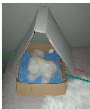
Figuur 4. Tent voor knuffel

Voor de kinderen die werden geplaatst in jeugdinstituten verloopt het transitieproces des te moeilijker. De veiligheid en geborgenheid die de (pleeg)families bieden, kan in de instituten niet worden gegarandeerd. Geregeld waren er discussies tussen de moeders en de instituten over een gebrek aan hygiëne en verzorging: ongekamde haren, ongewassen handen, ongeknipte nagels, ongewassen kleren en onbehandelde wonden. Bij drie van de acht kinderen die werden geplaatst in jeugdinstituten zijn er aanwijzingen en vaststellingen van seksueel grensoverschrijdend gedrag. In twee gevallen werd er klacht ingediend bij politie en parket. Hierop kwam geen respons. De confrontatie met het grensoverschrijdend gedrag haalde een van de moeders psychologisch onderuit, ook omdat ze de kans niet kreeg haar kinderen op dat moment op te vangen. Niet enkel omwille van de veiligheid is het belangrijk dat de kinderen terecht kunnen bij familie, maar ook omdat ze kunnen verblijven bij gekende en vertrouwde personen, die het best geplaatst zijn om de onthechting en ontworteling op te vangen en hun transitieproces naar een nieuwe, betrouwbare thuis te vergemakkelijken.